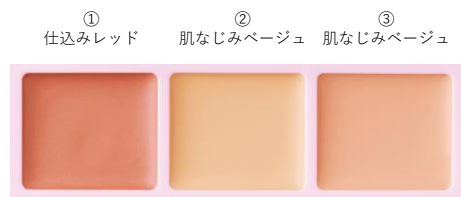
R-01(ライトベージュ) 肌のトーンを整えて明るい素肌感を演出