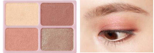
PK-03(マーガレットピンク)

オレンジ×ベージュのシンプルな組み合わせにキラッと輝くシルバーラメがおしゃれ見せ！