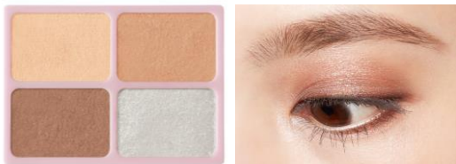
BR-06(キャラメルナッツ)

しっとり濡れたようなシアーな質感と高輝度ラメのきらめきが瞳をクリアに引き立てます。