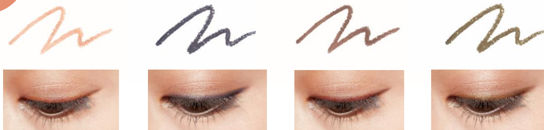
01 マンダリンゴールド 〈パールタイプ〉